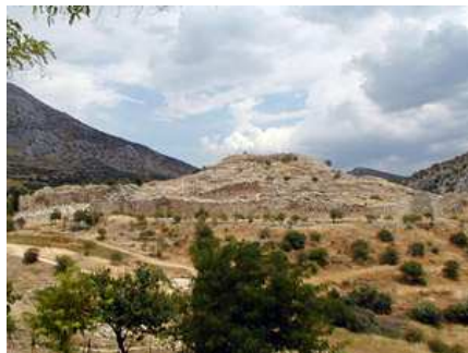
Mycènes entre 1450 et 1200 A.C.

Comme l'évoquent les deux illustrations, les évolutions intervenues dans la Grèce antique restent particulièrement appropriées pour introduire notre propos.